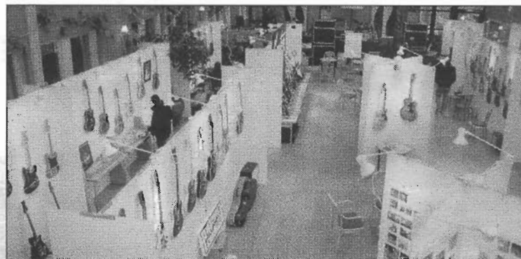
Störst. Över 250 Hagströmsgitarrer och andra instrument från samma företag visades i helgen på en jätteutställning i Östersund. Kanske blir utställningen och showen i Älvdalen nästa år?